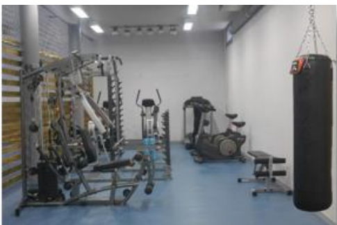
Salle d'Activité Physique Adaptée

Les soins sont assurés par une équipe pluridisciplinaire composée de deux médecins pédiatres, un pédopsychiatre, une équipe infirmière de jour et de nuit, une psychologue clinicienne, une assistante sociale, un